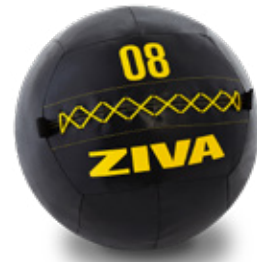
ZIVA Wall Ball/Medicinboll 4, 6, 8kg