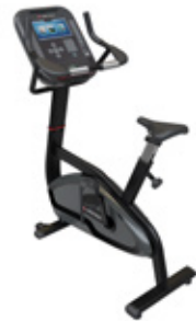
Star Trac 4 Series Motionscykel