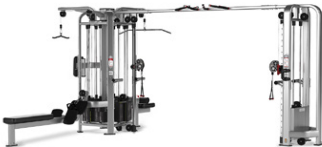
Nautilus Multi-Station 5 Station