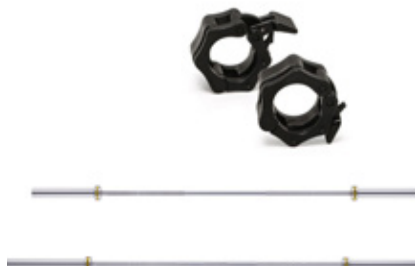
Skivstång 15kg & 20kg inkl. klämmor