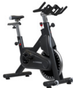
Schwinn SC5 Träningscykel