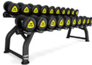
ZIVA Hantelställ 10 par