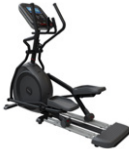
Star Trac 4 Series Cross Trainer