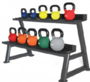
Neoprene Kettlebell & Rack 8, 12, 16, 20, 24kg