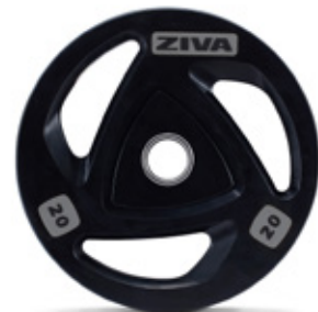
Grip Disc Viktplatta 2,5, 5, 10, 15, 20, 25kg