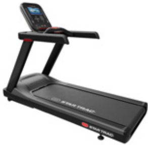
Star Trac 4 Series Löpband