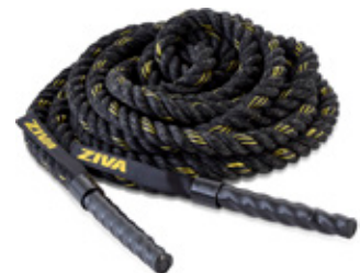
ZIVA Battle Rope Träningsrep