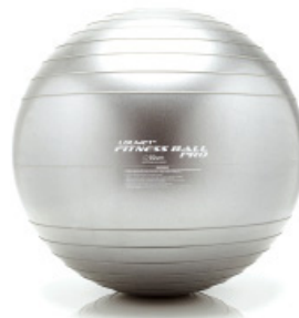
Pilatesboll 65cm Gymboll