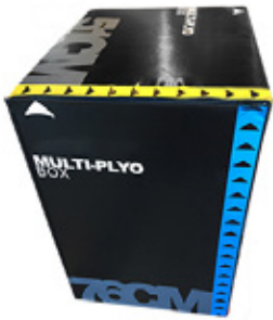
3-in-1 Plyobox höjd, 51, 61, 75cm