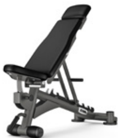
ZIVA Ställbar Träningsbänk