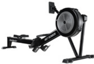
StairMaster HIIT Rower Roddmaskin