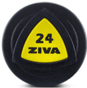
ZIVA Hantlar 12-30kg 2kg intervall