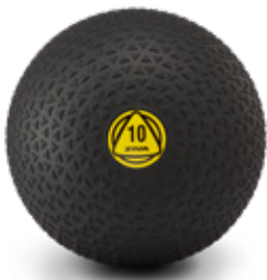
ZIVA Slam Ball 8, 12kg