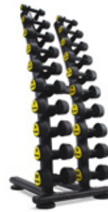
ZIVA Studiohantlar 1-10kg Inklusive ställ