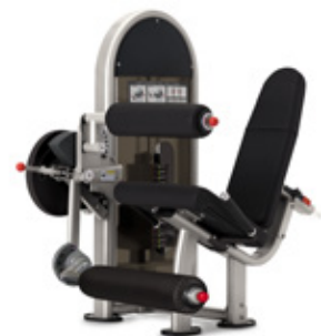
Nautilus Instinct Dualmaskin Benspark/Bencurl