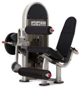
Nautius Instinct Dualmaskin Benspark/Bencurl