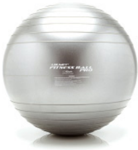
Pilatesboll 65cm Gymboll