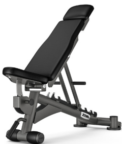
ZIVA Ställbar Träningsbänk