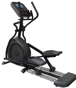
Star Trac 4 Series Cross Trainer