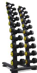
ZIVA Studiohantlar 1-10kg Inklusive ställ