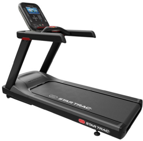
Star Trac 4 Series Löpband