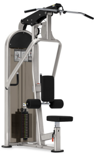
Nautius Instinct Dualmaskin Ryggdrag/Rodd