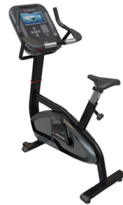
Star Trac 4 Series Motionscykel